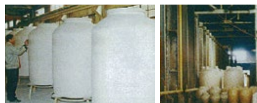
▲外観検査（白地検査）

外観検査（ひび、割れ、欠け）、安定性検査（すわりの悪さ）、水はり検査（水漏れ）、実際の貯蔵（液漏れ）を経て不良品が発生した場合は速やかに弊社にご一報願います。代金返却や次回納入での相殺などお打合せの上対応させていただきます。