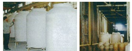
▲外観検査（白地検査）

外観検査（ひび、割れ、欠け）、安定性検査（すわりの悪さ）、水はり検査（水漏れ）、実際の貯蔵（液漏れ）を経て不良品が発生した場合は速やかに弊社にご一報願います。代金返却や次回納入での相殺などお打合せの上対応させていただきます。